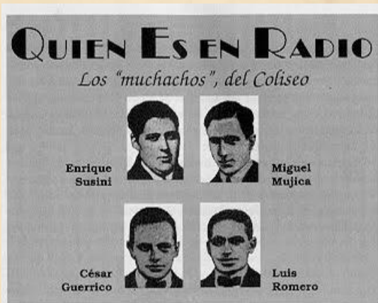
"LOS LOCOS DE LA AZOTEA"

Todo comenzó a principios de la década del 20, cuando el 27 de agosto de 1920 en Buenos Aires, un médico y sus amigos fueron los responsables de la primera transmisión de